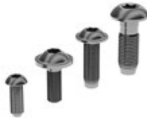
Selbstschneidende Schraube Self Forming Screw